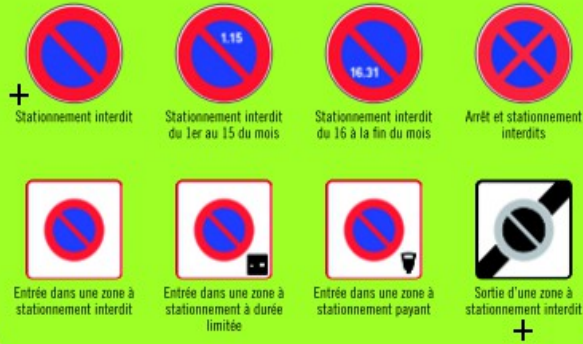
+ Stationnement interdit Stationnement interdit du 1er au 15 du mois Stationnement interdit du 16 à la fin du mois Arrêt et stationnement interdits Entrée dans une zone à stationnement à durée limitée Entrée dans une zone à stationnement payant Sortie d'une zone à stationnement interdit +

http://www.preventionroutiere.asso.fr/ Espace-multimedia/Des-quiz-pour-se-tester/ Code-de-la-route