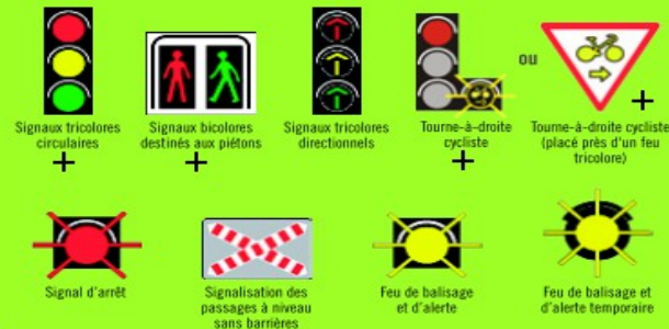
+ Signaux tricolores circulaires + Signaux bicolores destinés aux piétons + Signaux tricolores directionnels + Tourne-à-droite cycliste + Tourne-à-droite cycliste (placé près d'un feu tricolore) Signal d'arrêt Signalisation des passages à niveau sans barrières Feu de balisage et d'alerte Feu de balisage et d'alerte temporaire

En fonction de l'infrastructure ou du trafic, l'implantation de feux peut être nécessaire.